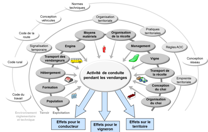
Figure 3 : les déterminants du travail : autant de leviers d'action possibles pour la prévention